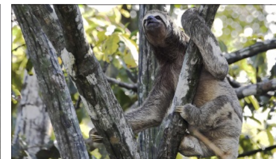
DYR: Biologisk mangfold er i faresonen når regnskog hogges. Dette dovedyr har klatret i et tre ved elva Jaraua.

MILJØ: Jair Bolsonaro er klimaskeptiker, og under ham har Brasils regnskogpolitikk endret seg.