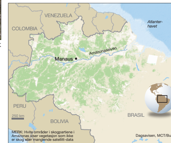
MERK: Hvide områder i skogpartiene i Amazonas viser vegetasjon som ikke er skog eller manglende satellitt-data. Dagsavisen, MCT/Bulls